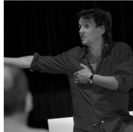
JEAN VILAR AVAIT D'ABORD ENVISAGÉ DE TRANSMETTRE SON SCEPTRE À GÉRARD PHILIPPE. LE DESTIN FIT QUE GEORGES WILSON EN HÉRITA, QUE ROGER PLANCHON LE TRANSPORTA À VILLEURBANNE, OÙ CHRISTIAN SCHIARETTI LE TIENT AUJOURD'HUI.