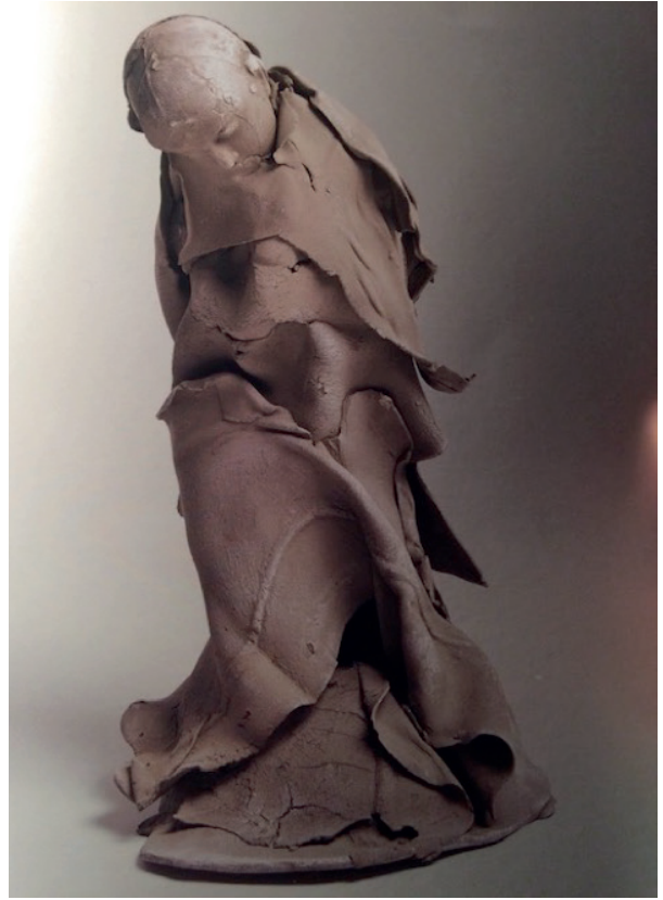
statue inuit et statue de Georges Jeanalos