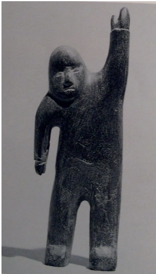
statue traditionnelle inuit

« Au minimalisme des cultures traditionnelles s'opposent le consumérisme actuel et cette incroyable abondance de biens dont l'homme civilisé a besoin pour accroître ses ressources d'énergie. "Vivre dans l'espace" signifie agir. "Vivre dans le temps" signifie consommer, échanger son temps de travail social en biens, en produits... »