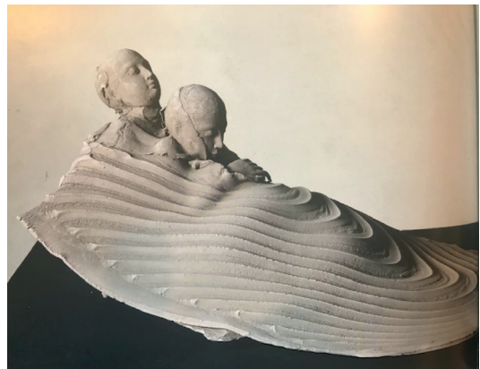
statue de Georges Jeanclos

Un espace épuré où seules des peaux d'animaux et du feutre formeront les reliefs d'un paysage enneigé. Des projections vidéo permettront de voyager sur les territoires que traversent les deux vieilles femmes : le bord d'une rivière, un bois, une plaine gelée et désertique etc. Sur scène, l'agilité inattendue des deux vieilles femmes – la chasse à l'écureuil, la pêche et la marche difficile – « Avancer pour ne pas geler » – sera accompagnée de trois danseurs-comédiens qui représenteront soit des personnages de la tribu, soit d'autres créatures qu'elles rencontreront : animaux, pièges, végétations... Un microphone placé en avant-scène, comme un îlot en dehors des paysages enneigés.