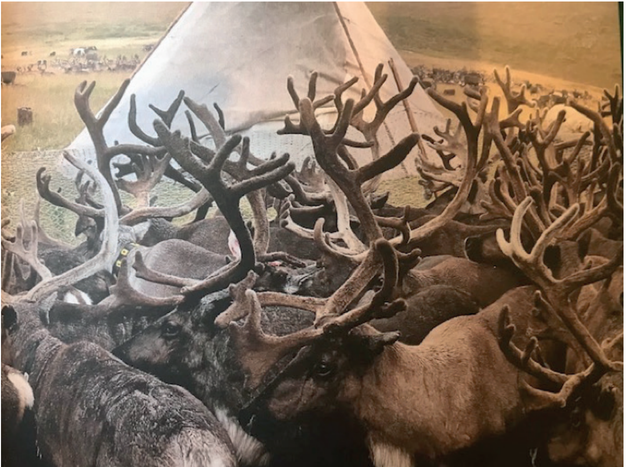
photo de caribous