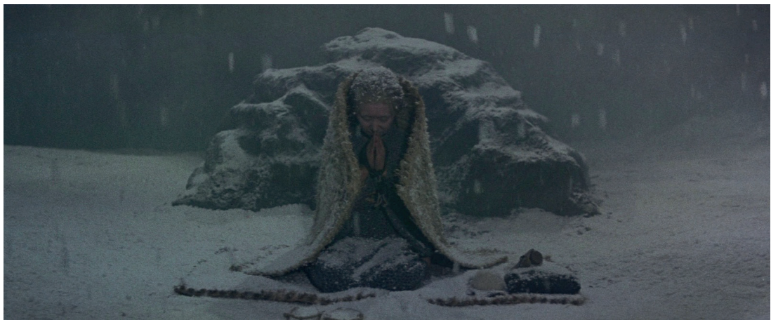
La ballade de Narayama de Imamura – film, 1983