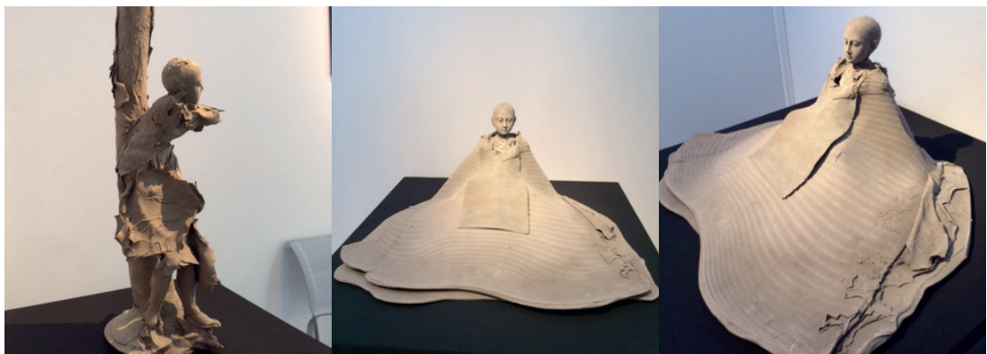
statues de Georges Jeanclos