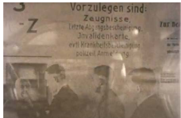
Montage d'archives, générique de Berlin Alexanderplatz de R.W. Fassbinder