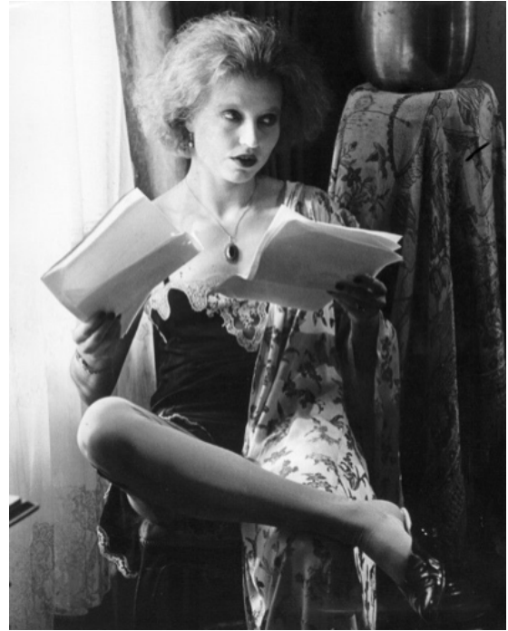
Hannah Schygulla dans Berlin Alexanderplatz de R.W. Fassbinder